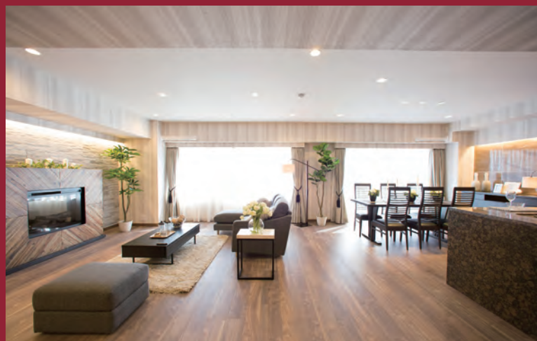
Scandinavia Style 当社施工例