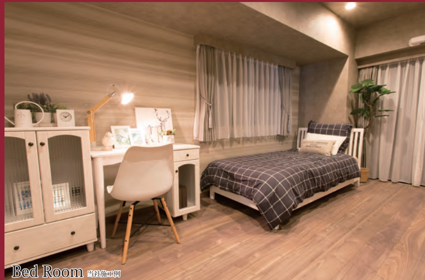
Bed Room 当社施工例