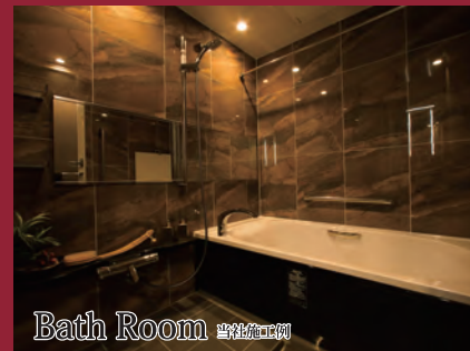
Bath Room 当社施工例