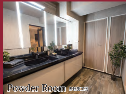
Powder Room 当社施工例