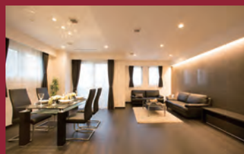
New York Manhattan Style 当社施工例